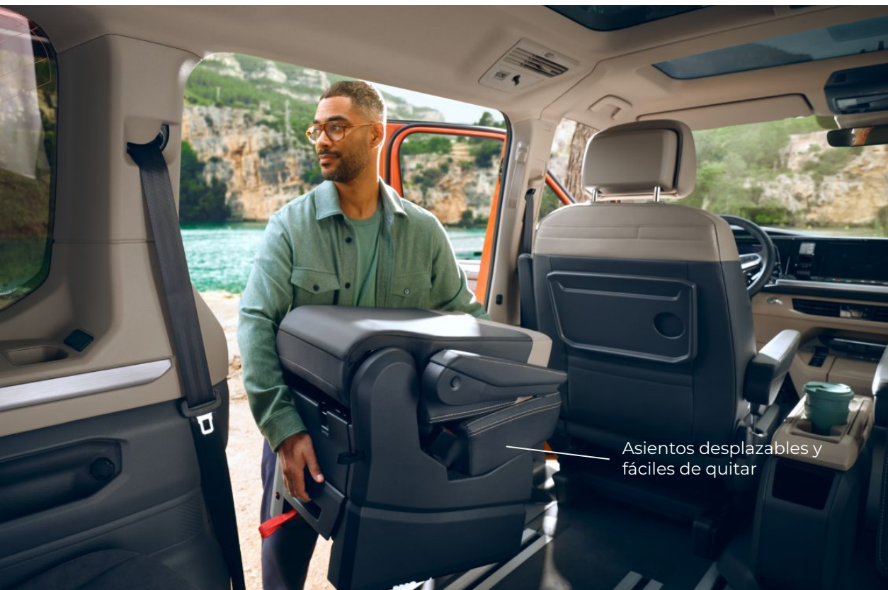
Asientos desplazables y fáciles de quitar