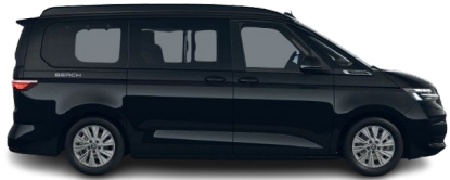
Deep Black Efecto Perla