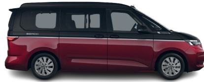
Deep Black Efecto Perla / Rojo Fortana