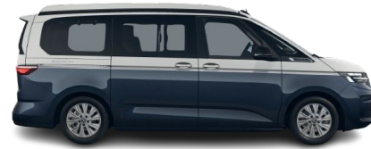
Blanco Candy / Starlight Blue Metalizado