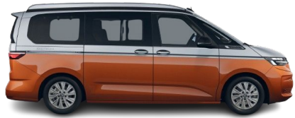
Monoplata / Energetic Orange