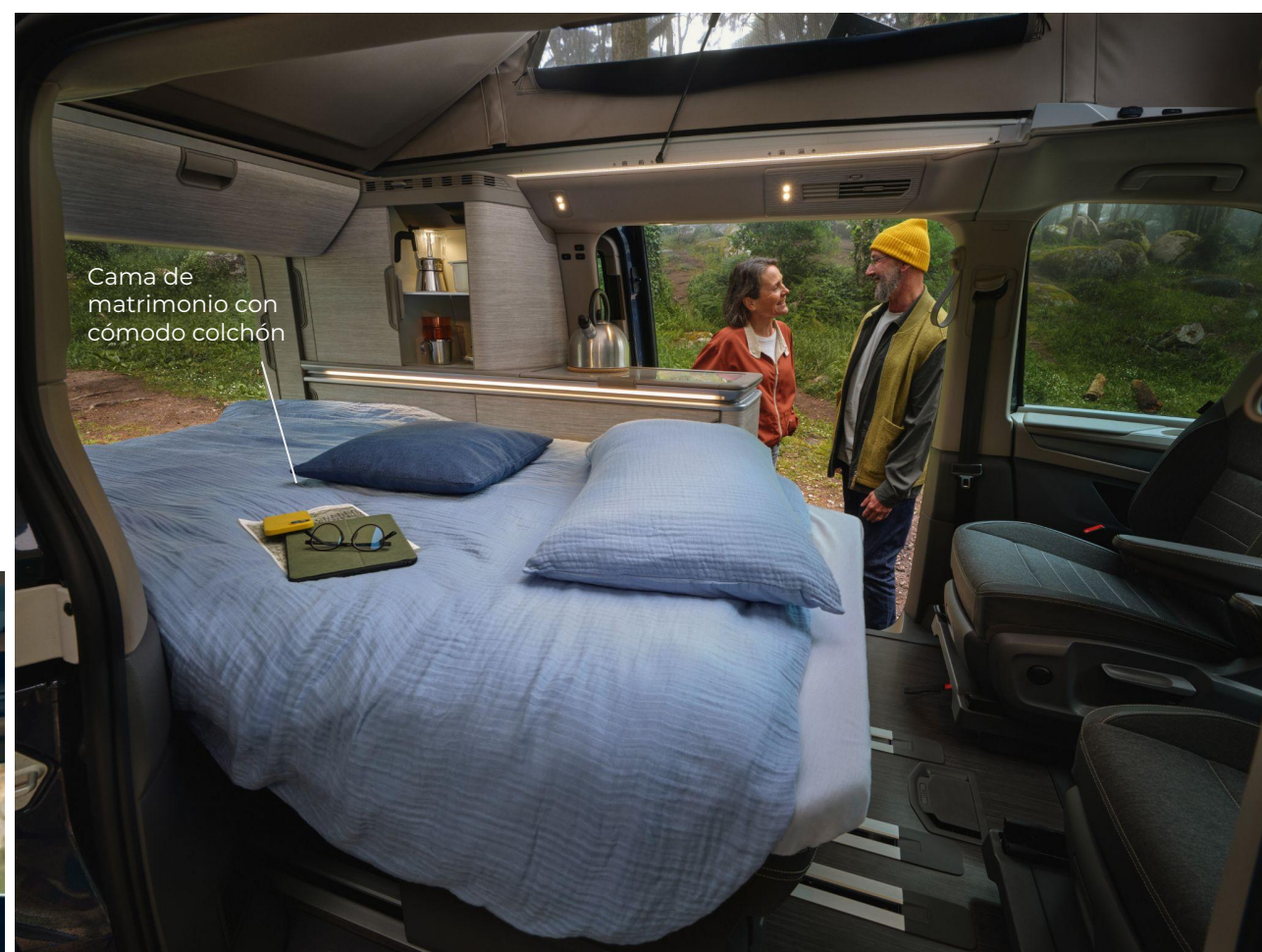
Cama de matrimonio con cómodo colchón